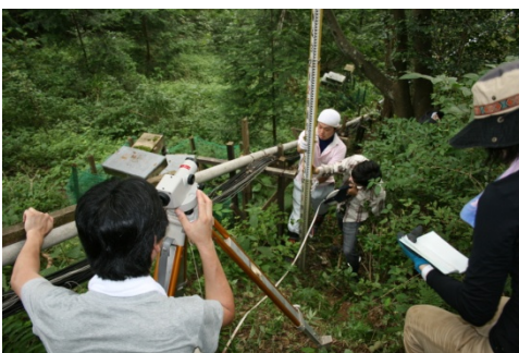
レベル測量の実習 その他、電気探査も実施