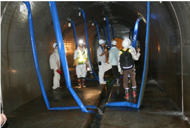
新しく建設された排水トンネル