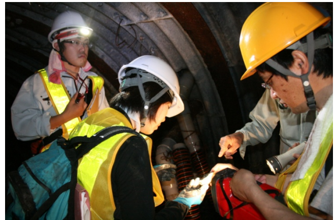
対策工についての説明を真剣に聞く院生たち