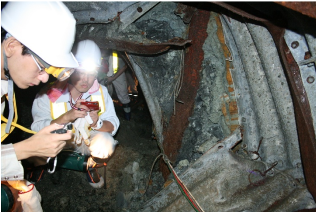
破壊された排水トンネルでのすべり面粘土の観察