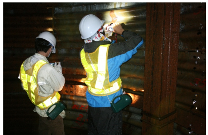
集水井内での排水状況及び地山の観察